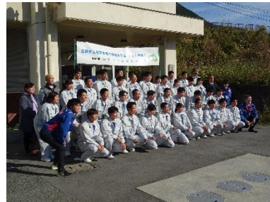
現地見学 1 万人突破 (令和 4 年 12 月)