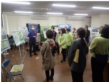
広報室での説明の様子