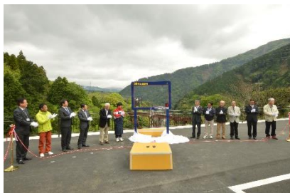
フォトフレーム除幕式 (平成 30 年 6 月)