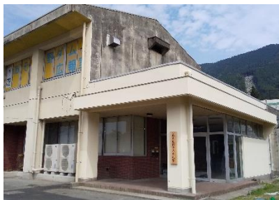
立野ダム広報室入口

【あそ立野ダム広報室利用の様子】 利用者数約 15,000 人(R6.3 末時点)